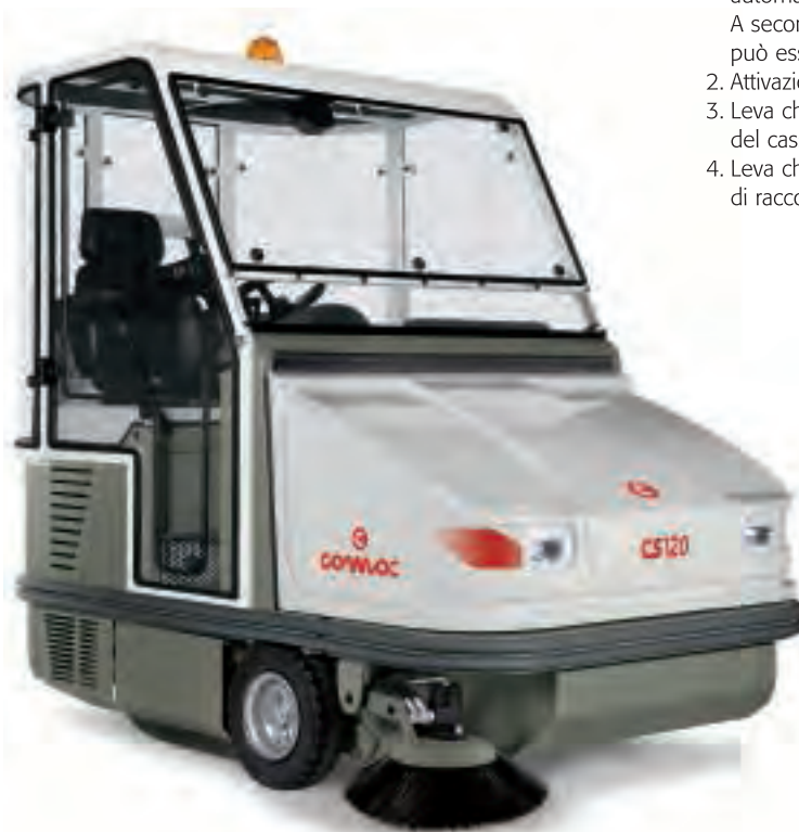
CS100/120 con cabina